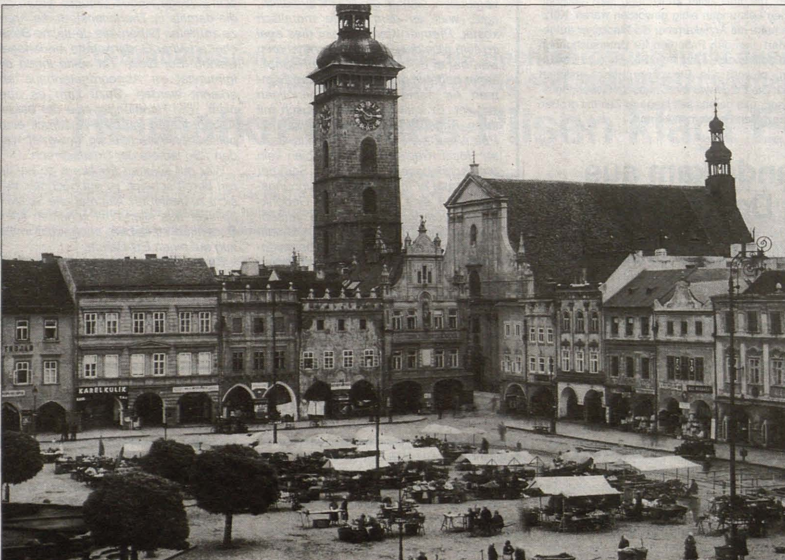
Budweis. Der Ringplatz mit dem Samsonbrunnen.